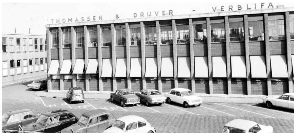
Carle C. Conway Laboratorium