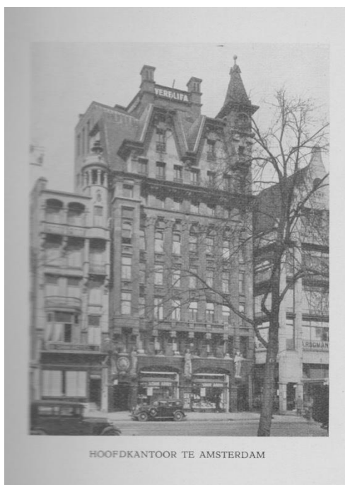
HOOFDKANTOOR TE AMSTERDAM

Vereniging van Pensioengerechtigden van het Pensioenfonds TDV