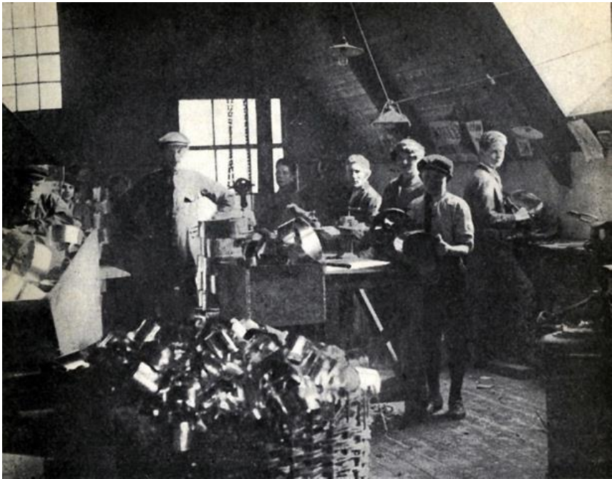
Bussen productie bij T&D op de zolder aan de Molenstraat 1920